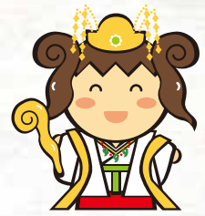
御杖村の「つえみちゃん」