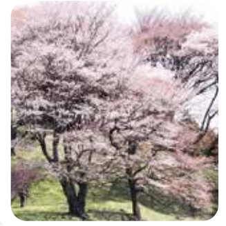
樹齢百年を超える「丸山公園」の山桜