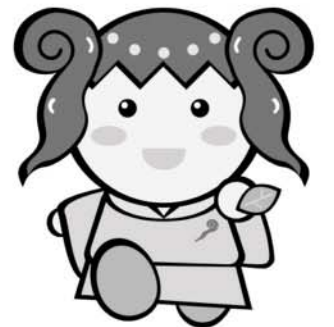
御杖村の「つえみちゃん」